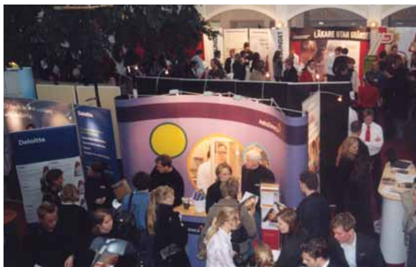
Fler än någonsin i vimlet på EEE-dagarna.

–Jag har också hört många positiva kommentarer om kontaktsamtalen. Under de två sista dagarna i februari fanns 52 företag på plats i Ekonomihögskolan och besökantalet uppskattades till cirka 1 500 per dag.