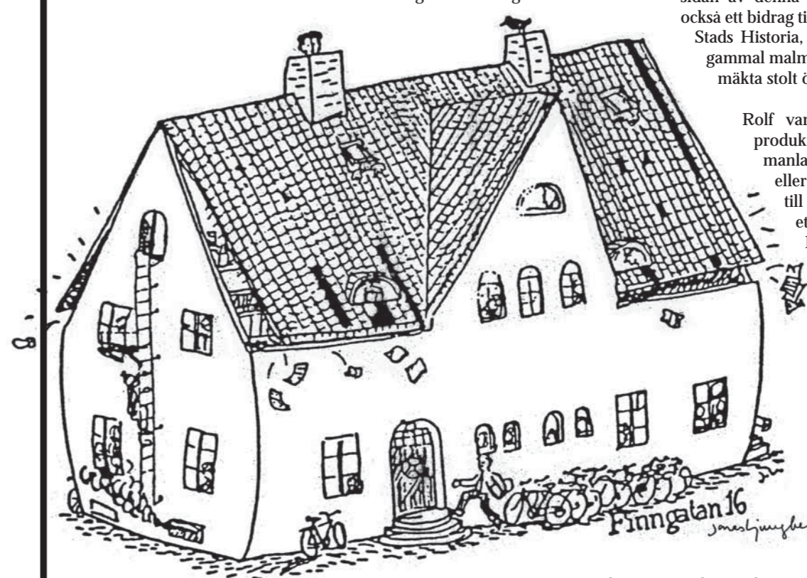
Visst var det trångt men det var också en stimulerande miljö. Professorsvillan på Finngatan, en donation som var ekonomisk historias hemvist innan flytten till Ekonomiceentrum.