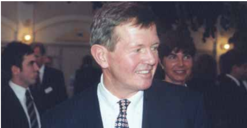
Marcus Wallenberg var gäst på Partnerskapets kontaktkonferens "Företagande och framtid" som hölls den 4 mars på Ekonomihögskolan i Lund.